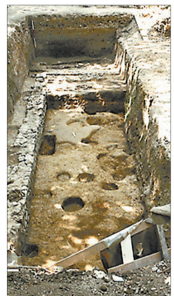
Ostaci dijela Anžuvske palače

Riječ je o običaju ugradnje novca u nakit, koji je primjenjivan od antike pa sve do današnjih dana. Za sada je nemoguće ustanoviti u kojem je povijesnom razdoblju ovaj primjerak korišten kao privjesak – amulet, ali ga činjenica da je riječ o jedinom nalazu grčkog novca na području Zagreba čini dragocjenim. SAK