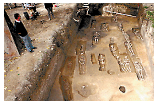
Na groblju otkrivena 33 groba sa skeletnim ostacima