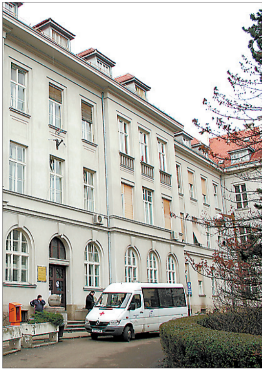
Ulaz u glavnu zgradu KBC-a na Šalati

Zagreb je danas podijeljen u četiri doma zdravlja: Centar, Istok, Zapad i Dom zdravlja Željezničar, unutar kojih je 13 ambulanta. Tako, Dom zdravlja Zagreb - Centar ima pod ingerencijom ambulante u Centru, na Medveščaku, Novom Zagrebu, Studentsku polikliniku i ambulante na Trnju i Ininu ambulantu. Dom Zdravlja Zagreb - istok u svom sastavu ima ambulante u Dubravi, Maksimiru, Peščenici i Svetetama. Dom zdravlja Zagreb - zapad ima ambulante na Črnomerecu, Susedgradu i Trešnjevci. A dom zdravlja Željezničar od 1991. prebacio je osniva-